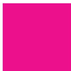
8055 NP FL Magenta (1017)