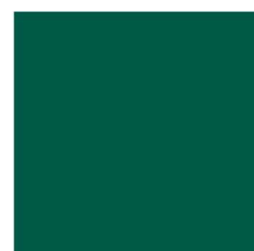
8025 NP Green (3443)