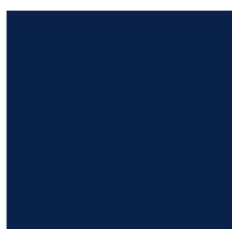
8010 NP Blue A (2441)