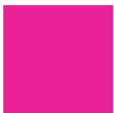
8090 NP FL Pink (6055)