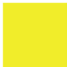
8080 NP FL Lemon (4041)