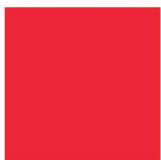
8095 NP FL Red (6057)