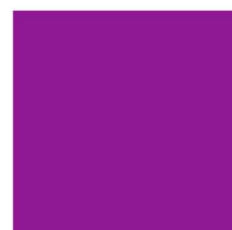
8060 NP FL Violet (1038)