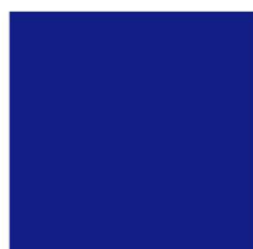
8020 NP Marine (2443)