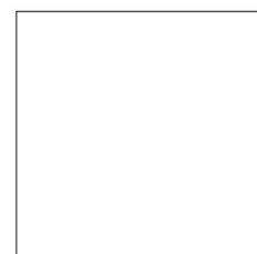
8050 NP White (9256)